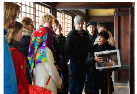
(英語ツアーのイメージ)