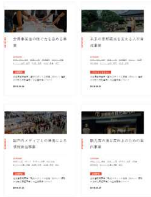
法人ホームページ画面イメージ