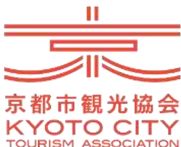
ロゴマーク（新規作成）