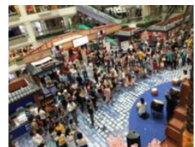
北京国際旅遊博覧会（BITE）2018 会場の様子