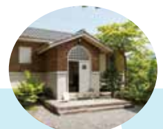
岩倉具視幽棲旧宅