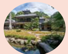
旧三井家下鴨別邸