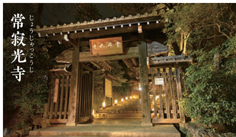
常寂光寺 じょうじょうくわうじ