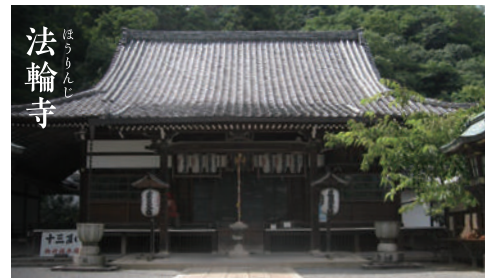
法輪寺 ほうりんじ