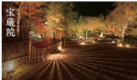
宝厳院 ほうげんいん