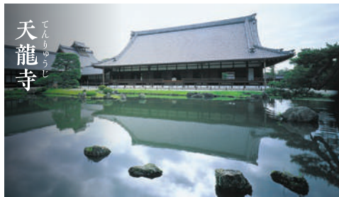
天龍寺 てんりゅうじ