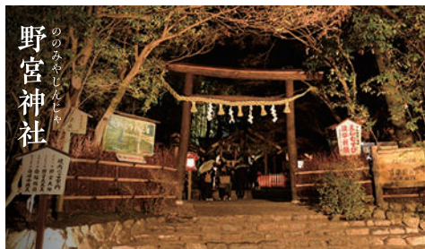
野宮神社 ののみやしんじ