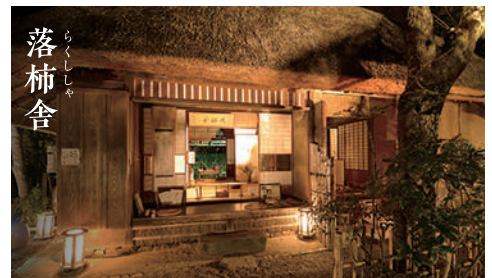
落柿舎 らくしきしゃ