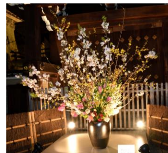
「いけばなプロムナード」

イラストやメッセージなど、来場者が自由に描いたオリジナルデザインの行灯を作成・展示