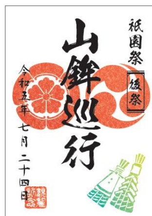
観覧記念符・後祭