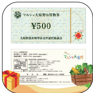
とっておきの京都賞 マルシェ大原野 お買物券 (2,000円分×5名)