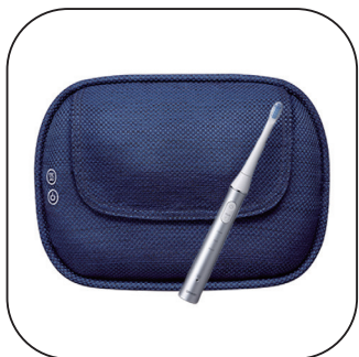
向日市賞 電動歯ブラシ クッションマッサージャ (オムロンヘルスケア)