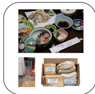
大山崎町賞 三笑亭 ペア食事券 アキツ産業 ペアグラス ハム工房古都 詰め合わせ