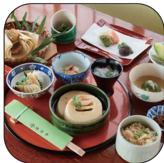
長岡京市観光協会賞 長岡天満宮 八条ヶ池 池畔 錦水亭ペア お食事券

他にも京都西山エリアの寺院や神社、各店舗からの副賞多数！ たくさんの応募をお待ちしています！！