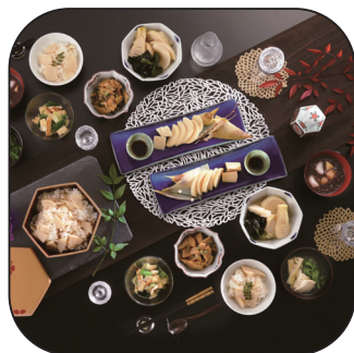
長岡京市賞 冷凍京たけのこ懐石 京笋 +筍加工品・米油セット (小川食品工業)