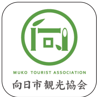
向日市観光協会賞 選べるプラン！ 向日市内飲食店お食事券 (タクシー送迎付)