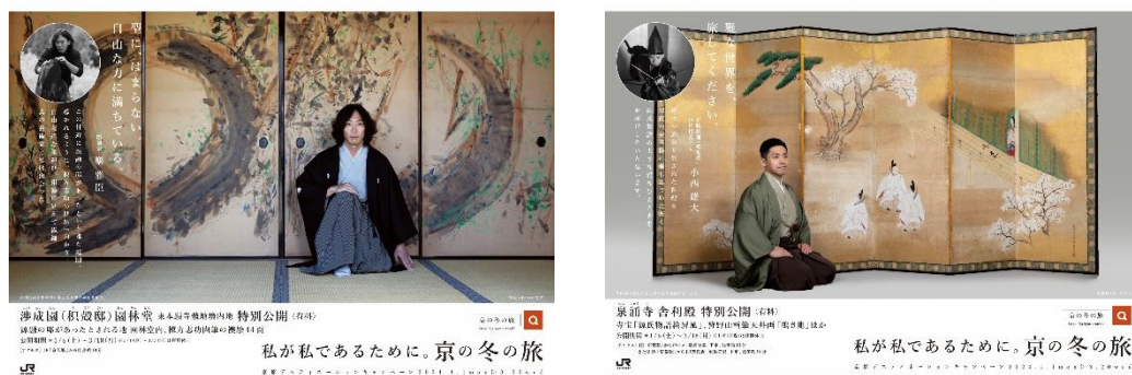
JRグループの主な駅・車内で展開するポスターの一例 ※画像はイメージです

＜京都デスティネーションキャンペーン「第58回京の冬の旅」JRグループポスター＞