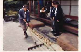
スキルアップ研修

観光事業者とのビジネスマッチングや、スキルアップを目的とした研修の開催、通訳ガイド検索サイト「クレマチス」への登録など、通訳ガイドとして活躍していただくためのサポートを行います。