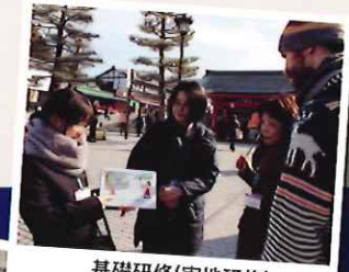
基礎研修(実地研修)