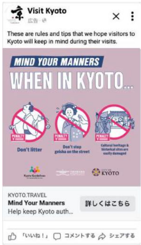
Facebook MIND YOUR MANNERS（バナー）