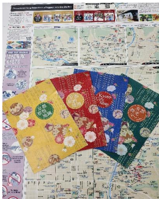
【作成媒体のイメージ】