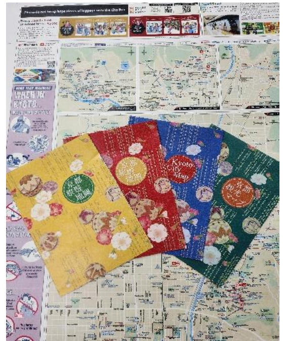
【作成媒体のイメージ】