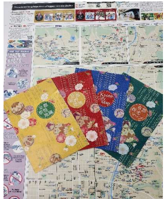
【作成媒体のイメージ】