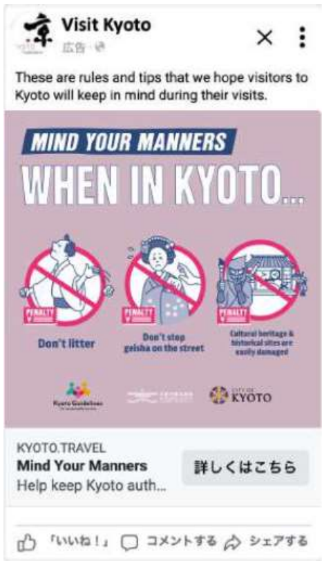
Facebook MIND YOUR MANNERS（バナー）