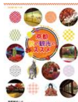
「京都 秋の観光のススメ」表紙

https://www.city.kyoto.lg.jp/sankan/page/0000317969.html