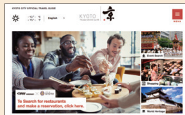
京都市外国人向け観光サイト「KYOTO CITY OFFICIAL TRAVEL GUIDE」にてご紹介

「京都市内のホテル」、「観光案内所」、「訪日外国人ワンストップ観光情報サイト“LIVE JAPAN”」等から、訪日外国人を本サイトへと誘導いたします!