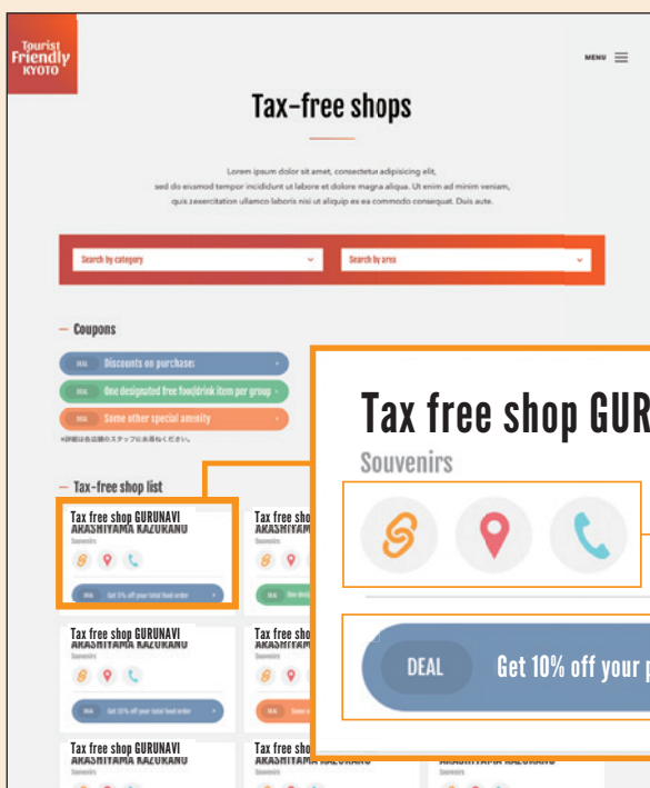
免税店一覧イメージ