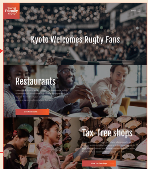
特設サイトイメージ