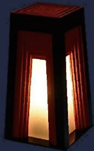
第11回最優秀賞 「伏見」 京木工芸行灯

千本鳥居をモチーフにし、 幾重にも重ねられた 朱塗りの鳥居から洩れる光と その奥から和紙を通した 柔らかい光を放つ露地行灯 高さ480mm 幅250mm 奥行き250mm