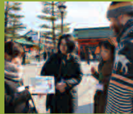
●基礎研修(実地研修)の様子