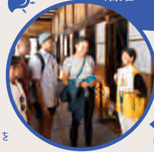
●二条城の公式ガイドとして英語ツアーを実施