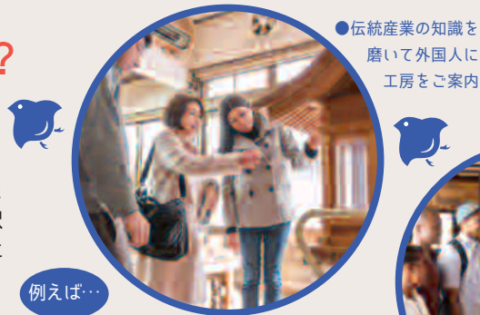
●伝統産業の知識を磨いて外国人に工房をご案内

通訳ガイド検索サイト『クレマチス』への登録、観光事業者とのビジネスマッチングや、スキルアップを目的とした研修への参加など、通訳ガイドとして活躍していただくためのサポートを行います。*個人の収入、その他の利益などを保証するものではありませんのであらかじめご了承下さい。