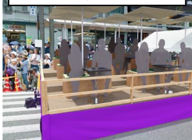
プレミアム観覧席（イメージ）