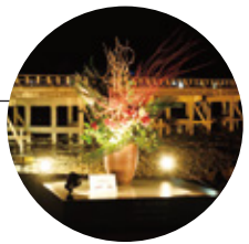
「いけばな プロムナード」