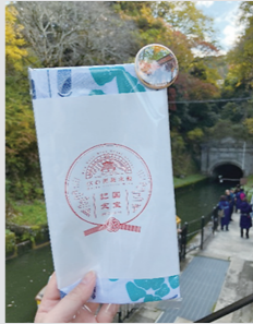
記念品の手ぬぐいと缶バッチ

また秋運航は、10月3日（金）からスタートし、52日間にわたって、多くのお客さまにご乗船いただき、前年度を上回るお客さまで賑わい、無事終了いたしました。