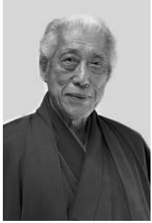
千玄室 裏千家15代・前家元

国際的な視野で茶道文化の浸透と世界平和を願い各国を歴訪。外務省参与、ユネスコ親善大使、日本・国連親善大使などの公職・役職を持つ。文化勲章、レジオン・ドヌール勲章、コマンドール(フランス)など各国より多数受章。京都市・ホノルル市名誉市民など国内外の多くの名誉市民を受ける。