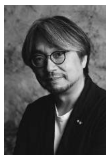
小山 薫堂 京都芸術大学副学長

放送作家、脚本家。日本大学芸術学部在学中に放送作家として活動開始。多くのテレビ番組の企画・構成、脚本を手掛け、「料理の鉄人」「トリセツ」や映画「おくりびと」では、国内外で高い評価を受け、各賞受賞。エッセイ、作詞などを幅広く活動する。下鴨茶寮主人、京都館館長。2025年大阪万博エリアフォーカスプロデューサー。