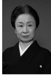
井上 八千代 京舞井上流五世家元

観世流能楽師片山幽雪(九世片山九郎右衛門)・人間国宝の長女。祖母井上愛子(四世井上八千代)人間国宝に師事。2000年五世井上八千代を襲名。日本芸術院会員、重要無形文化財各個指定(人間国宝)保持者。