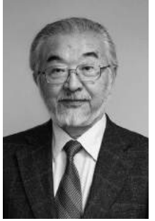
尾池 和夫 京都芸術大学 学長

1940年東京生まれ。京都大学理学部卒業。第24代京都大学総長。2008年から日本ジオパーク委員会委員長。13年4月から京都芸術大学学長(現職)。著書に、「日本列島の巨大地震(岩波科学ライブラリー)」、「日本のジオパーク(ナカニヤ出版)」など。