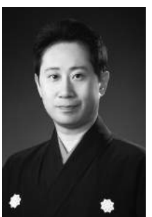
片山 九郎右衛門 観世流能楽師

片山幽雪(九世片山九郎右衛門)の長男。2011年十世片山九郎右衛門を襲名。姉は京舞井上流五世家元井上八千代。片山定期能楽会を主宰。全国での公演に出演、海外公演にも積極的に参加。重要無形文化財総合指定保持者。国民文化祭・京都2011の開閉会式舞台プロデューサー。