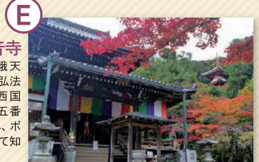
今熊野観音寺 平安時代、嵯峨天皇の勅願により弘法大師が開創。西国三十三所第十五番札所、頭痛封じ、ボケ封じの寺として知られます。