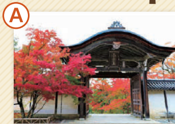
二尊院 総門は伏見城の遺構と伝えられる薬医門。本尊に釈迦と阿彌陀の二如来を祀っています。