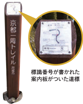
標識番号が書かれた案内板が書いた道標

京都一周トレイルのなかでも人気の東山コース・西山コースの一部がスタンプラリーの対象です。ヤマスタで該当コースに参加して出かけたら、ルート上にある所定の標識番号の道標周辺でチェックインしよう。チェックイン場所周辺の名所をデザインしたスタンプが出てきます。