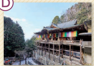
狸谷山不動院 「タヌキダニのお不動さん」の名で知られ、懸崖造りの本堂には安置300年を超える石像不動明王が鎮座しています。