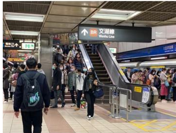
台湾 80%程度 *2020/2/12撮影