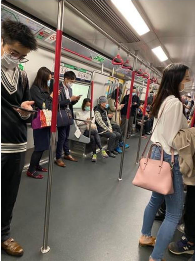
香港 ほぼ100% *2020/2/14撮影

香港=自分の身は自分で守る 台湾=できるだけマスクは着ける シンガポール=感染の可能性がある場合に着ける