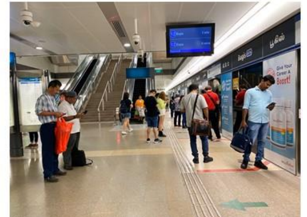
シンガポール 20% *2020/3/6撮影